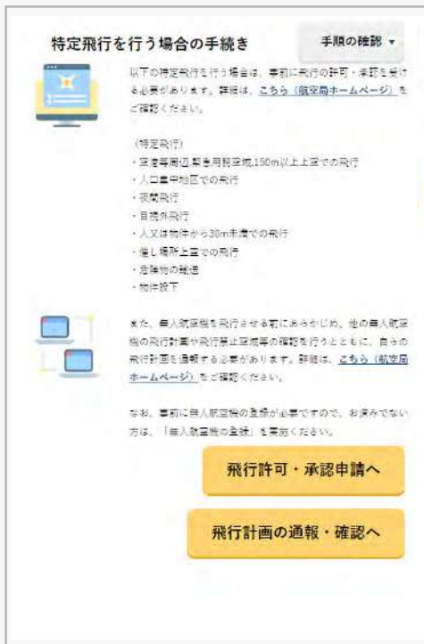
機体認証、技能証明の取得手続